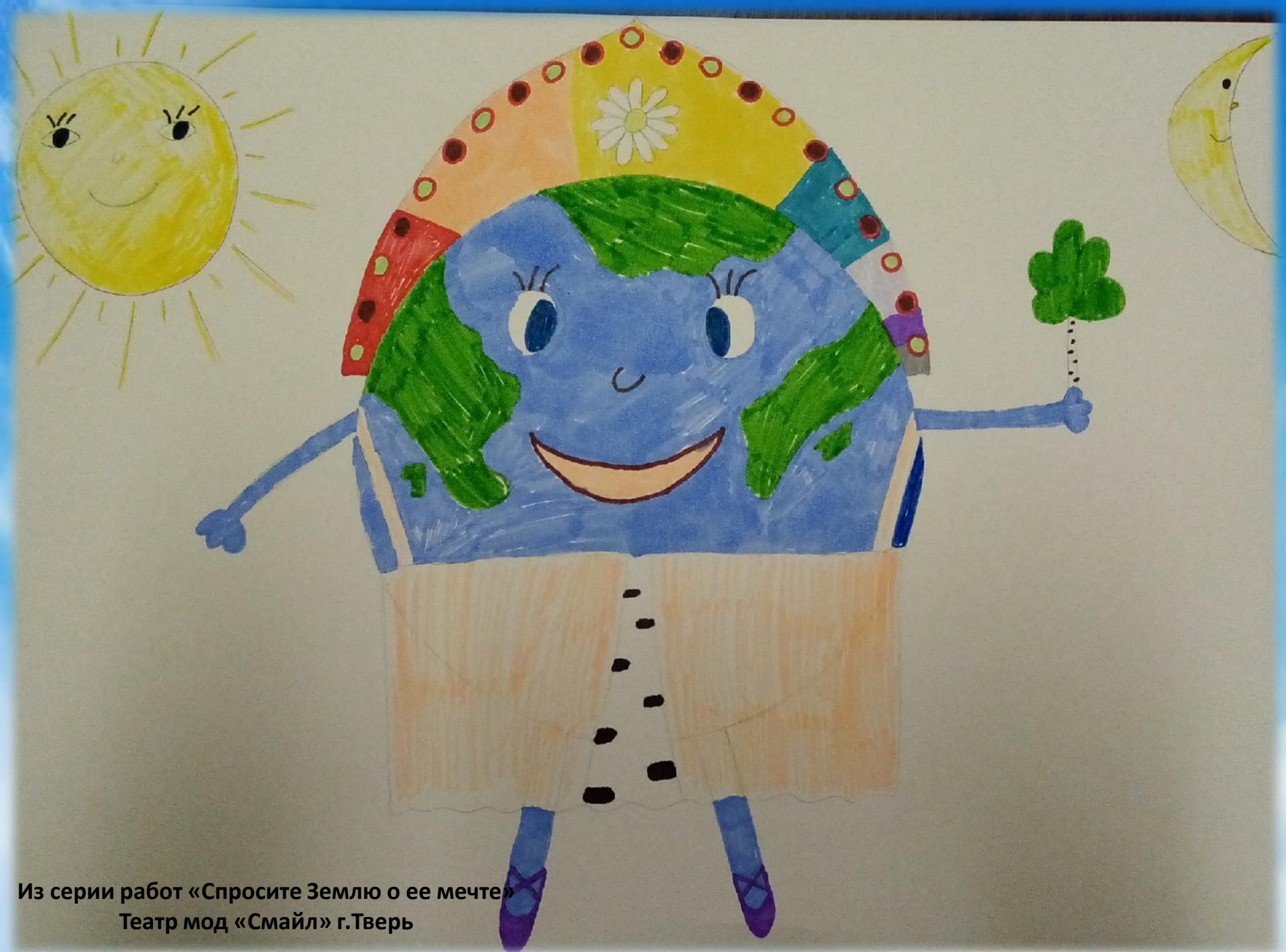
Из серии работ «Спросите Землю о ее мечте» Театр мод «Смайл» г.Тверь