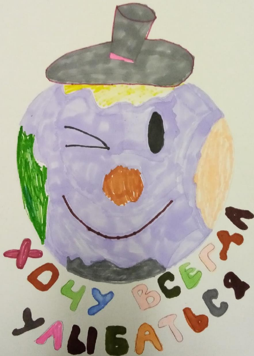
Из серии работ «Спросите Землю о ее мечте» Театр мод «Смайл» г.Тверь